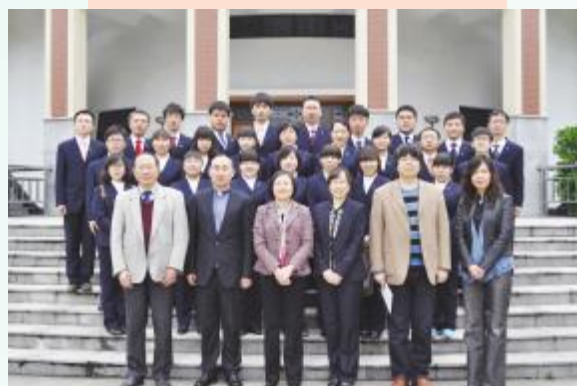
▲吉林圣经学校师生来访