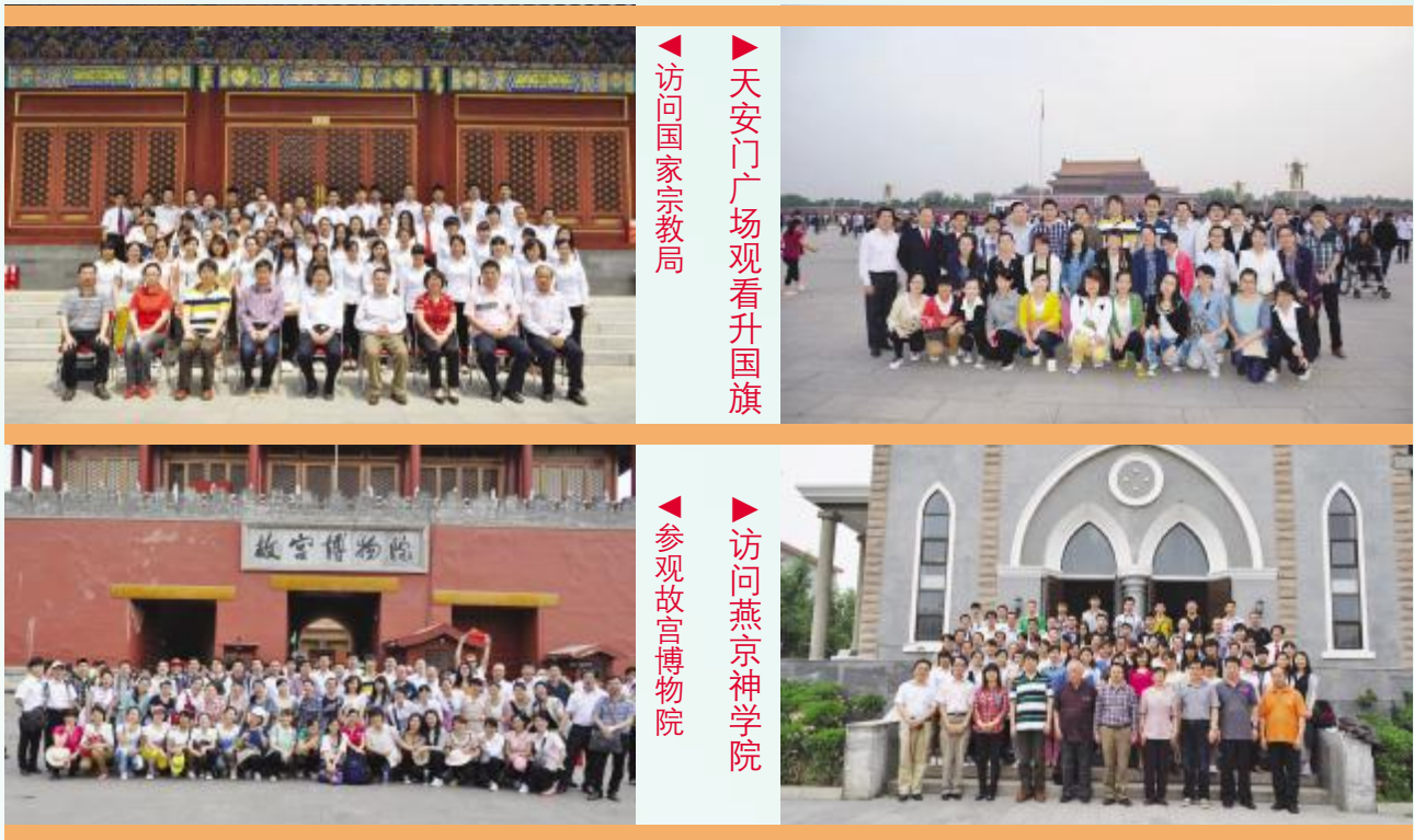
访问国家宗教局 天安门广场观看升旗