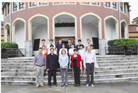
▲浙江神学院师生来访