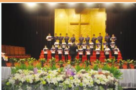
圣乐班在伯特利教堂献唱