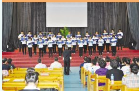
圣乐班在橄榄山礼堂献唱

通过这次北京和哈尔滨的访问与交流，毕业班同学的眼界得以开阔，见识得到增长，经验得以丰富。通过交流与学习，毕业班同学也看到自身装备的不足，深感毕业之后还要努力追求。这样的交流与学习，大家感到获益匪浅，终身难忘。