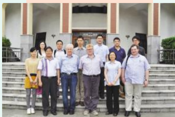
▲香港明华神学院访问团来访我院