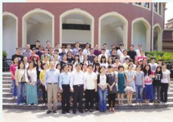
▲金陵协和神学院师生来访