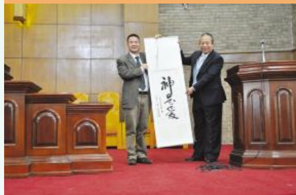
谢牧师与吕牧师互赠礼品